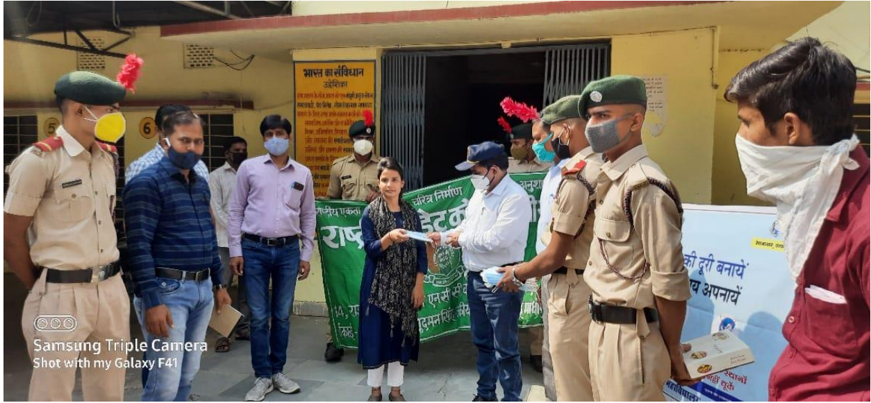
Samsung Triple Camera Shot with my Galaxy F41