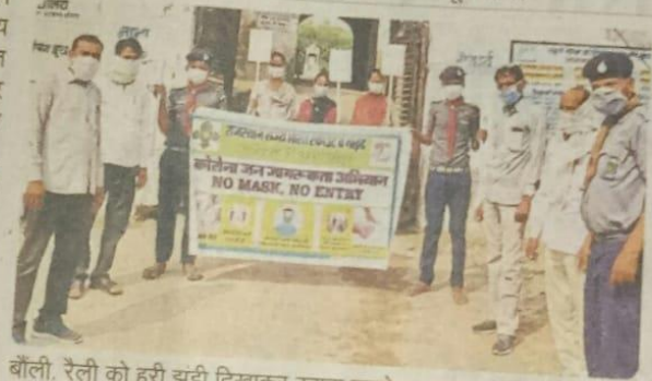
बौली. रैली को हरी झंडी दिखाकर रवाना करते प्रधानाध्यापक।