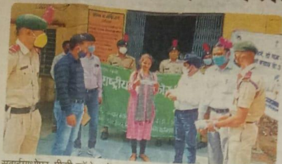
सवाईमाधोपुर. पीजी कॉलेज में हुए कार्यक्रम में मौजूद लोग।